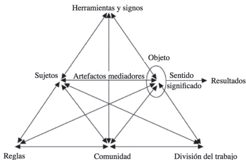
Figura 1. Un sistema de actividad y sus componentes. Adaptado de "Expansive Learning at Work: Toward an activity theoretical reconceptualization", por Y. Engeström, 2001, Journal of Education and Work , vol. 14, núm. 1, p. 135.

Un sistema de actividad se integra por una multiplicidad de trayectorias y experiencias diferenciadas. El estado actual de la actividad fue constituido mediante la evolución de prácticas laborales concretas, en concordancia con el desarrollo socio-histórico del sistema. Al interior de éste, herramientas y signos median la consecución de resultados. El objeto de la actividad (los estudiantes, para el caso del entorno escolar) involucra sentidos y significados socialmente organizados, refrendados en la acción cotidiana. Un sistema de actividad incluye reglas y procedimientos previamente establecidos (pero modificables), interpelando una relación multi-direccional entre componentes.