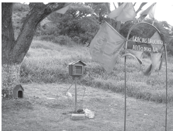
2006 – Jujuy. R. A. (Ruta Nac. 9, orientación norte sur, mano derecha. Alto Comedero). Gauchito Gil, según nuestra descripción Santuario Norte.

este modo siempre van al lugar a agradecerle, encenderle unas velas, beber con él y bailarle, entre otras actividades, pero sólo entre ellos, aunque aceptan a quien se acerca a acompañarlos. Desde ese día una de las imágenes del Gauchito no está más en su urna ya que fue obsequiada a uno de nosotros para que nos acompañe, así como nos fue entregada una llave de la puerta de dicha urna para poder abrirla y encender una vela al pasar.