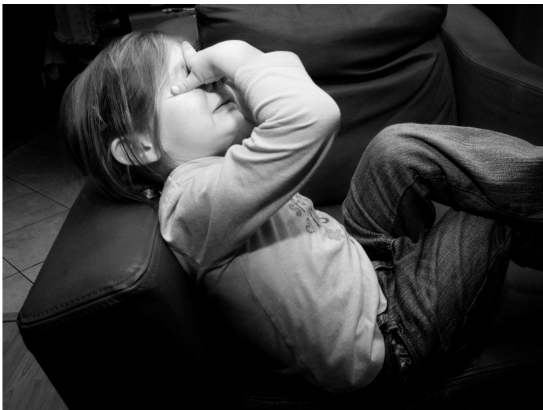
Sin título, 2011.