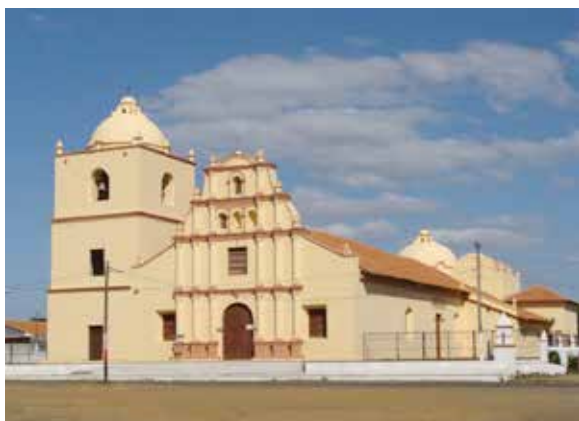
Figura 6. Iglesia San Juan Bautista de Sutiaba, enero de 2010, después de los trabajos de renovación emprendidos para el 4to. centenario del traslado de León a los parajes de Sutiaba.