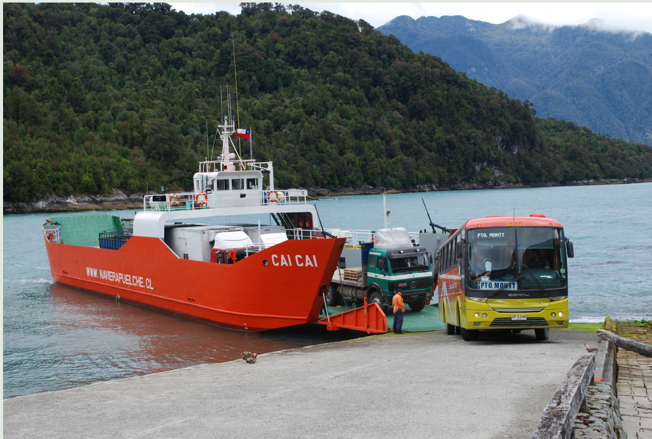
Imagen 1. Caleta Leptepu. Barcaza para transporte de carga y pasajeros