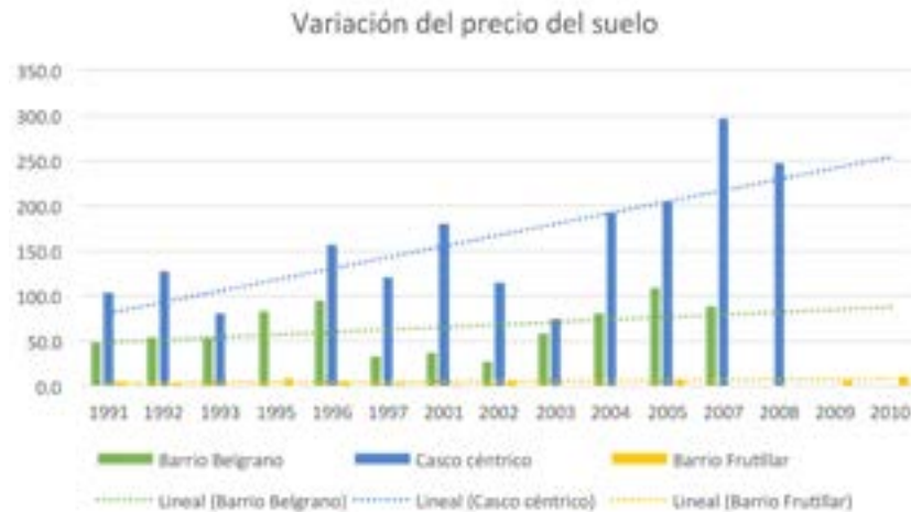
Figura 2. Precio promedio del suelo ofertado (US$/m 2 ) en tres áreas de San Carlos de Bariloche, 1991-2010

Fuente: elaboración personal a partir de los avisos clasificados en la revista local ABC.