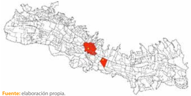
Figura 4. Traslado de la clase dominante del centro histórico a La Mariscal