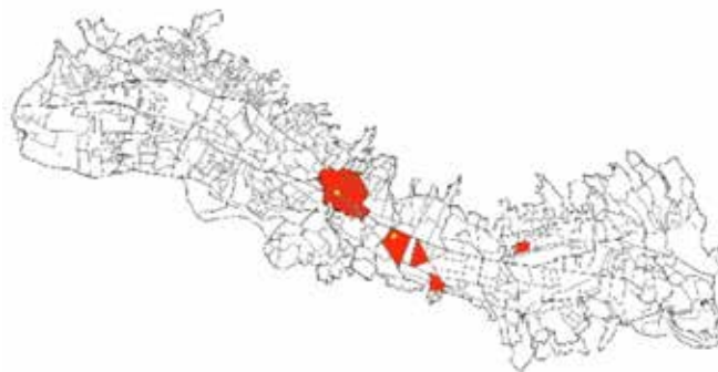
Figura 5. Barrios La Pradera, La Paz y El Quito Tenis

Las zonas más cercanas hacia el norte de La Mariscal eran La Pradera y al antiguo hipódromo de la ciudad, el cual, se convirtió en el parque urbano más importante, resultado del relleno de quebradas y del drenaje de la laguna de Ñaquito que se formaba por la afluencia de las aguas del volcán Pichincha. Esta obra de ingeniería al lado de casas modernas y de lotes grandes contribuyó a crear el estilo de la ciudad jardín tan perseguido por la clase dominante.