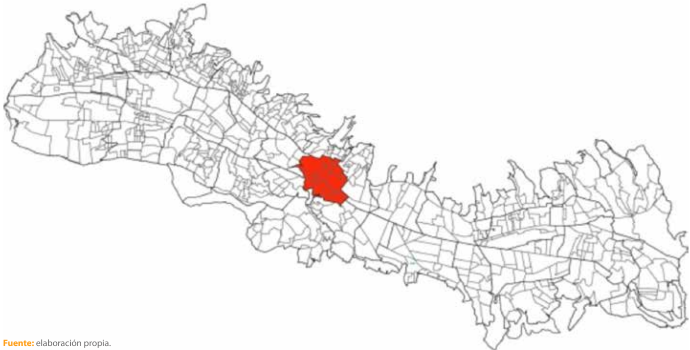
Figura 2. Centro histórico de Quito

Como preferían vivir cerca entre sí, las familias de la clase dominante residían en la primera estructura de la ciudad que se había fundado, alrededor de la Plaza Grande. Mientras más importante era la familia, más cerca de la Plaza mayor residía. Cuando hacían falta más casas, se construían alrededor de las que ya existían, quedando la Plaza como centro de gravedad de la ciudad y generando así lo que se conoce como el centro histórico de Quito, recogido en la Figura 2.