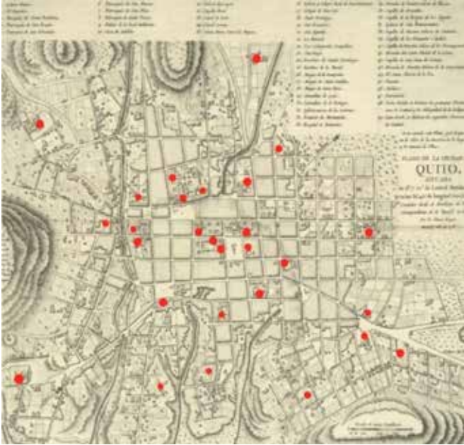
Figura 3. Ubicación de las iglesias de Quito a finales del siglo XVIII