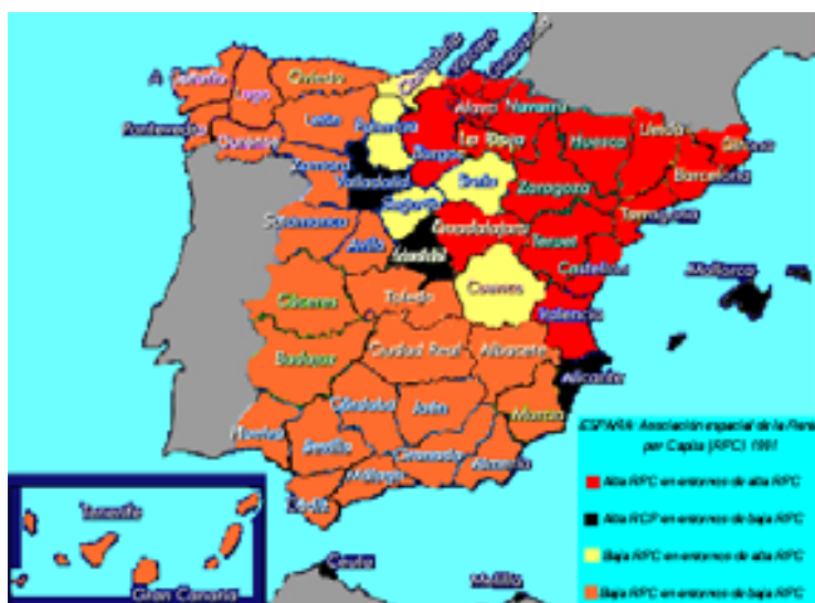
FIGURA 2 DIAGRAMA GRÁFICO DE DISPERSIÓN CORRESPONDIENTE A 1991

Como comprobamos en la Figura 2, la asociación espacial se mantiene cuando utilizamos los datos del año 1991, e incluso, en cierto modo se acentúa, con-