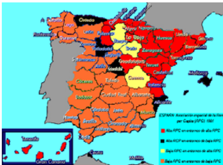
FIGURA 1 DIAGRAMA GRÁFICO DE DISPERSIÓN CORRESPONDIENTE A 1981

Los resultados obtenidos con el test de la I de Moran ponen de manifiesto una clara asociación espacial en la renta per cápita de las provincias. Las provincias con una renta per cápita alta se sitúan en el Noreste de la Península, concentrándose en el resto del territorio español las provincias con una renta per cápita baja. La dependencia espacial por tanto, es claramente positiva, como apuntaban los tests de autocorrelación espacial.