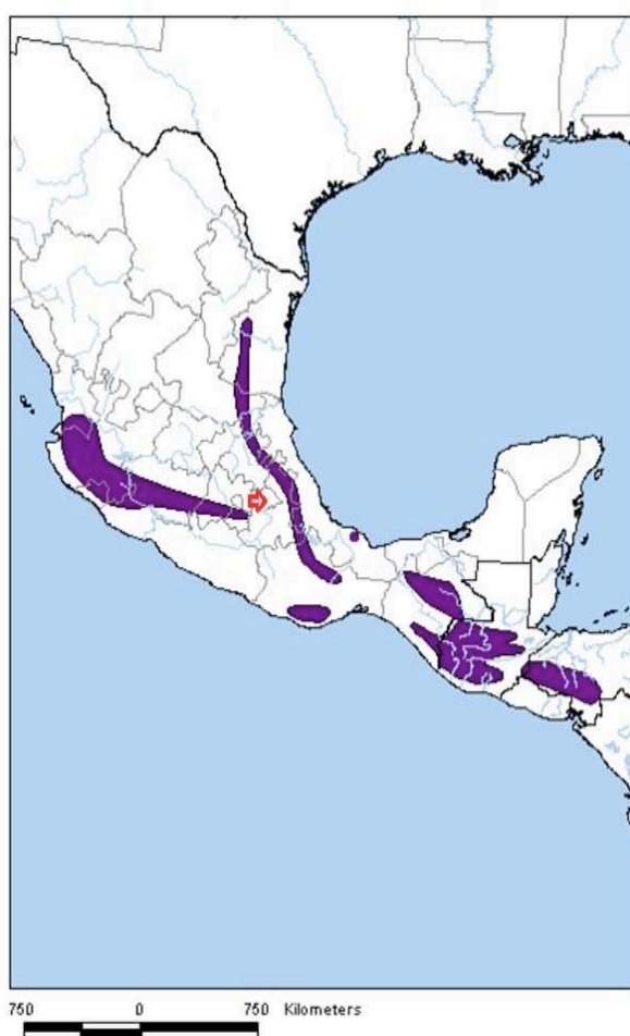
Figura 1. Mapa de distribución de Lampornis amethystinus (Infonatura 2007, tomado de Ridgely et al. 2007). La flecha indica la localización del Parque Nacional “La Malinche” en Tlaxcala.

subcaudales con bordes pálidos, las plumas caudales de color negro-azul, y las rectrices externas con la punta ligeramente gris. Las plumas de este individuo presentaron desgaste medio. Los rasgos descritos sugieren que se trataba de un adulto (Williamson 2001). Por otra parte, la hembra capturada presentó rasgos similares, excepto por la ausencia de la tonalidad rosa-magenta de la garganta, la cual tenía una pigmentación de color canela pálido a pardo (Figura 2). No se dispuso de claves para determinar la edad.