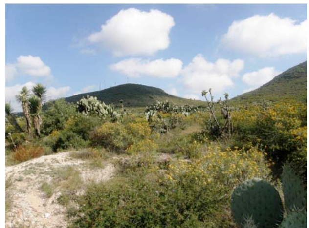
Figura 2. Vegetación (matorral xerófilo) en el Parque Ecológico Cubitos donde fue capturado el chipe patillado ( Geothlypis formosa ).