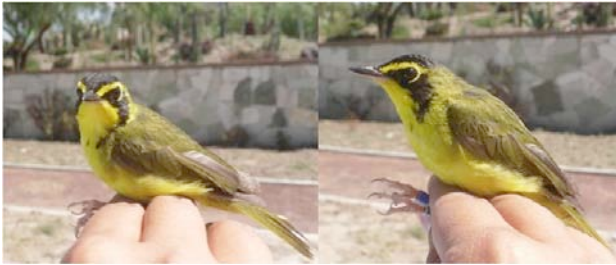
Figura 3. Chipe patillado ( Geothlypis formosa ) capturado en el Parque Ecológico Cubitos, Pachuca, Hidalgo, México.