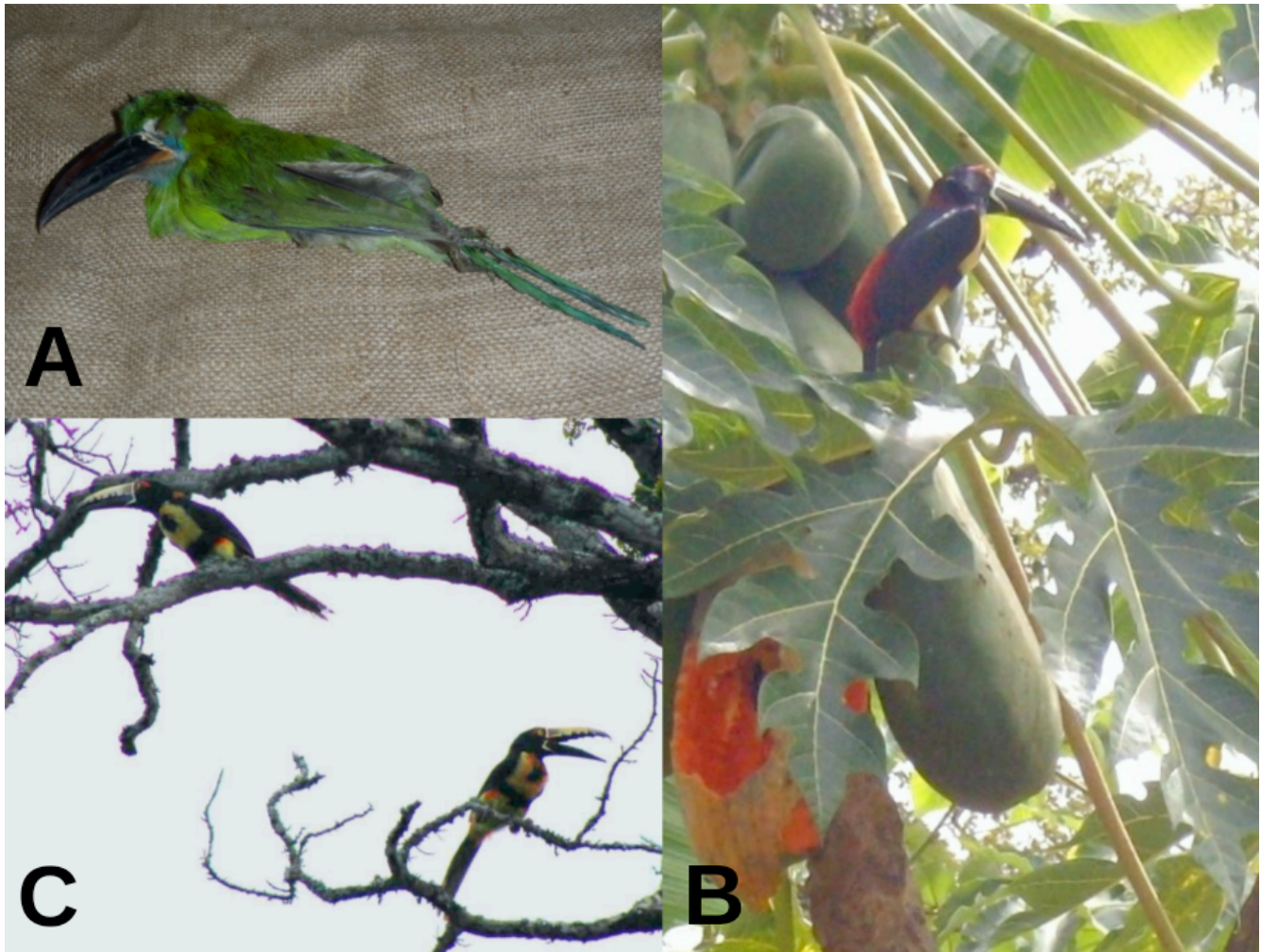
Figura 2. Tilingo acollarado, Pteroglossus torquatus nuchalis, y pico de frasco esmeralda, Aulacorhynchus sulcatus sulcatus, en el estado Cojedes. 2A. A. s. sulcatus (juvenil), Cerro Azul, Macizo de Nirgua, 22 de febrero de 2004 ; 2B. P. t. nuchalis, El Baúl, Girardot, 2 de enero de 2011 ; 2C. P. t. nuchalis, Zanja de Lira, Girardot, 13 de octubre de 2014.