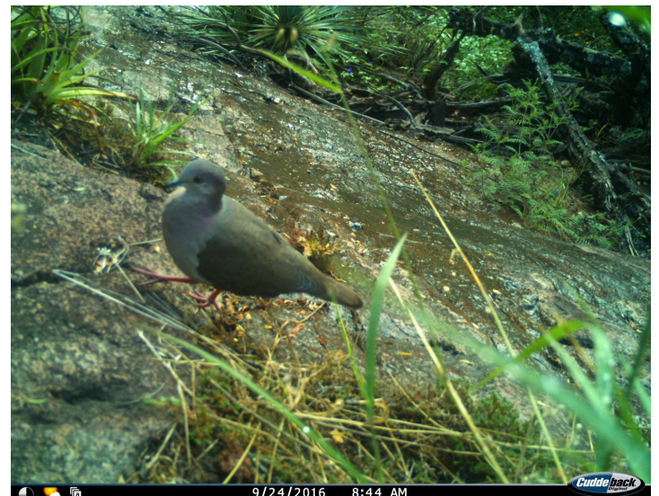
Figura 1. Individuo de Leptotila plumbeiceps registrado en el río Manzanares, Reserva de la Biosfera Sierra Gorda de Guanajuato.