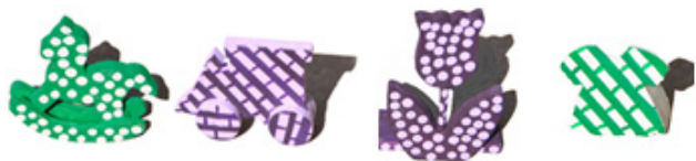
Figura 5. Opciones de la prueba de extensión orden 1 (izquierda) y orden 2 (derecha).

poseía la propiedad-meta (flor a lunares o vestido a cuadros) y el distractor (Figura 5).