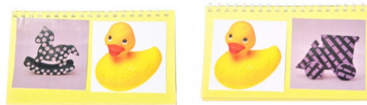
Figura 4. Libro utilizado en el estudio 2. Izquierda: objeto con la propiedad meta (Orden 1) y pato amarillo. Derecha: pato amarillo y objeto con la propiedad meta (Orden 2).

Materiales. Construimos un libro con ocho fotografías de objetos familiares: seis con propiedades convencionales -pato amarillo, oso peludo, cielo nublado, arcoíris colorido, pelota redonda y papel arrugado-, y dos con no convencionales -caballo a lunares: propiedad meta/ tren a cuadros: distractor-. El libro fue contruido de la misma manera que el del Estudio 1. La Figura 4 ilustra dos páginas de este libro. También utilizamos dos objetos reales -caballo a lunares, tren rallado-. Una propiedad -lunares- funcionó como propiedad-meta para la mitad de los participantes (Orden 1). La otra propiedad -cuadros- funcionó como propiedad-meta para la otra mitad de los participantes (Orden 2).