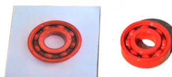
Figura 2. Opciones presentadas en la fase de prueba.

3. Fase de prueba. La tarea consistía en mostrar de manera simultánea la imagen del objeto-meta y el objeto-meta real, pidiendo al niño o niña que eligiera uno de ellos: ¿Dónde hay un pompe ? (Figura 2). Esta tarea buscaba indagar si el objeto real era igual o más aceptable como referente de una palabra nueva que su imagen.