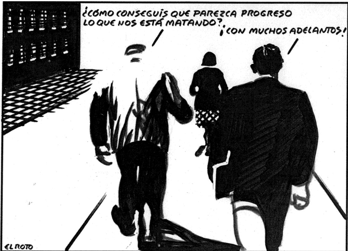
Figura 2. Andrés Rábago mostra en aquesta vinyeta la seva lúcida prevenció contra el "progrés" mèdic (reproducció amb permís de l'autor).

És obvi que el discurs tecnòlatra no s'ha de combatre amb arguments retrògrads o nostàlgics. Cal posar en evidència que no és tracta d'un discurs científic sinó d'una ideologia autorreferent que sosté que qualsevol problema o limitació que generi la tecnologia es resoldrà com a conseqüència del propi progrés tecnològic. Cal també posar en evidència que la tecnolatria atempta contra els valors professionals. Seguint al gran pensador moral Alasdair McIntyre, hem de defensar els valors interns de la professió, aquells que ho són "per a tota la comunitat implicada en l'activitat", es a dir, aquells que promouen la relació de confiança entre el metge i el malalt, la prioritat de la seguretat, el principi de beneficència, la solidaritat, la compassió i la transparència amb els col·legues. D'altra banda cal denunciar la persecució dels valors externs , es a dir, els valors que són "sempre propietat i possessió d'un sol individu", aquells que quan "més tingui jo menys tindran els demés" com ara la fama, el lucre o el poder (39).