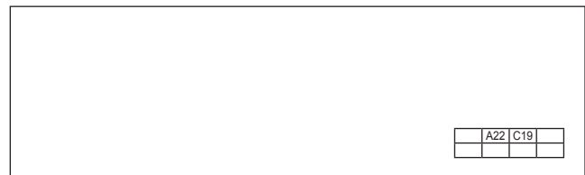
Figura 1. Hoja con cuadrícula y coordenada clave al respaldo.

Al respaldo de cada hoja de cuadrícula, en la parte inferior izquierda, había dos coordenadas (diferentes para cada plantilla) correspondientes a la respuesta correcta (véase Figura 1).