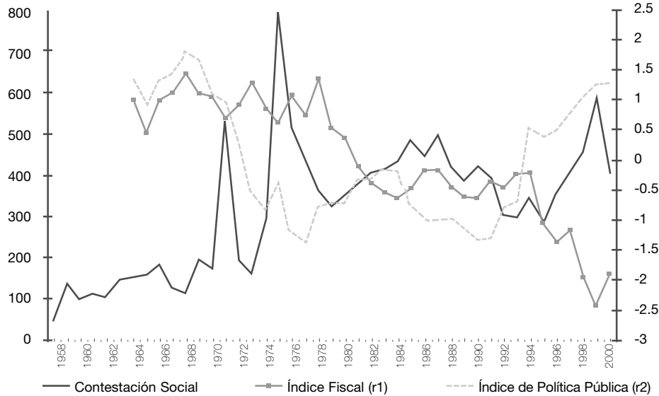
Figura 1. Contestación social y capacidades del estado, Colombia 1958-2000 (Correlaciones: r_1 = -.46^{***} , r_2 = -.41^{**} , N=37 )