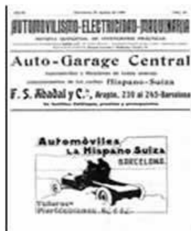
(f.1) Automovilismo-Electricidad-Maquinaria . Núm.16- Año III. Barcelona 25 Agosto de 1907