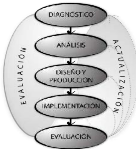
Gráfico 2. Metodología propuesta para el SEDLUZ

A continuación, se presenta la propuesta metodológica para la elaboración de los programas académicos adaptada al Sistema de Educación a Distancia de la Universidad del Zulia (SEDLUZ). Esta definición es utilizada por la dependencia y fue descrita en función de los fundamentos teóricos que rigen la materia. De tal manera, en primera instancia se definirán las fases del modelo con la finalidad de comprender el alcance y naturaleza de cada una de ellas. Ver Gráfico 2.