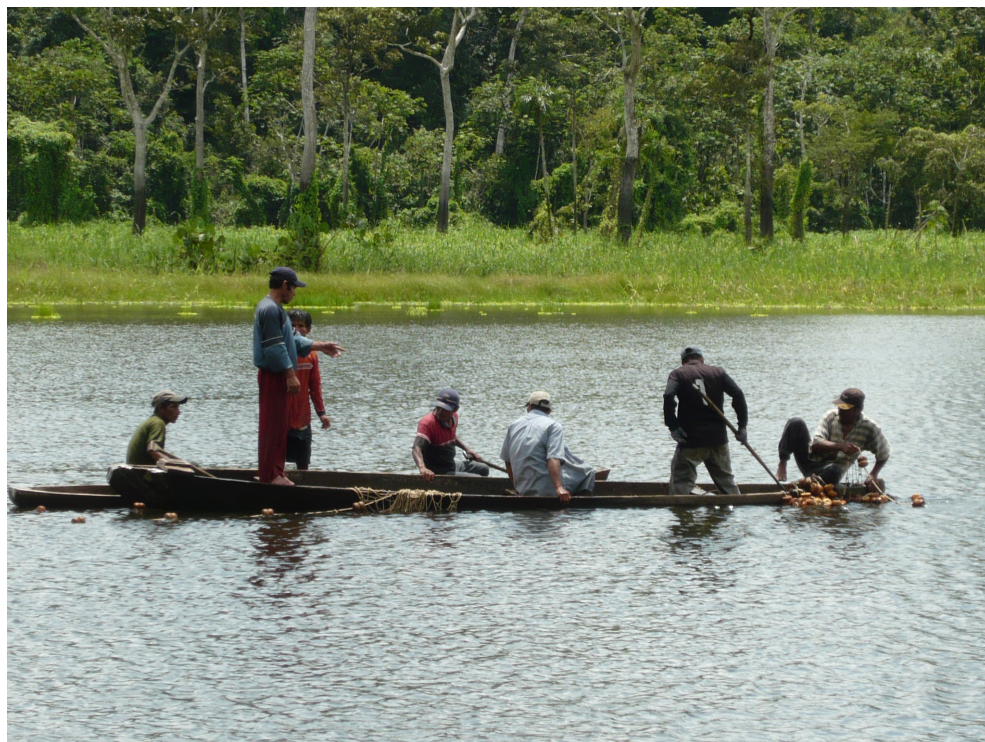
Fig. 2. Integrantes del grupo Tigres Negros pescando paiche (Arapaima gigas) en la laguna Jacinto.