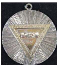
Escudo de la logia Unión Fraternal de Puerto Limón, organizada en 1892.