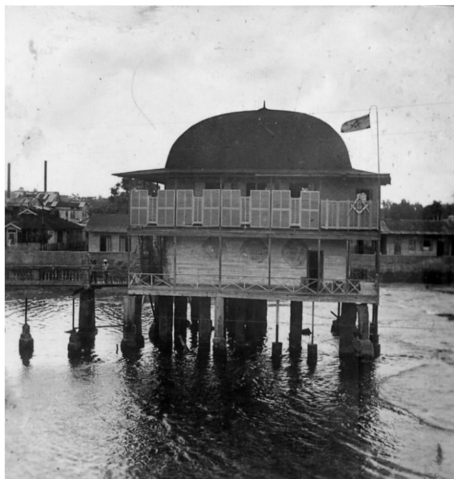
Templo masónico de la logia Unión Fraternal de Puerto Limón.