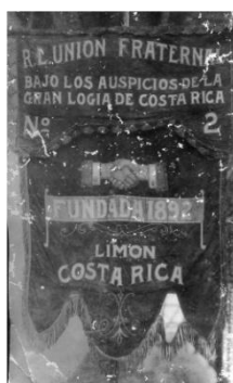
Estandarte de la Logia Unión Fraternal de Puerto Limón.