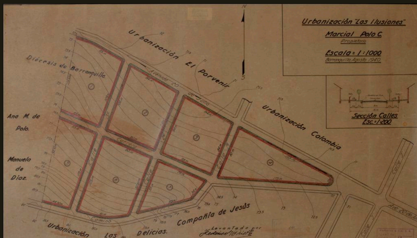
Plano 5. Urbanización Las Ilusiones. 1939-1940