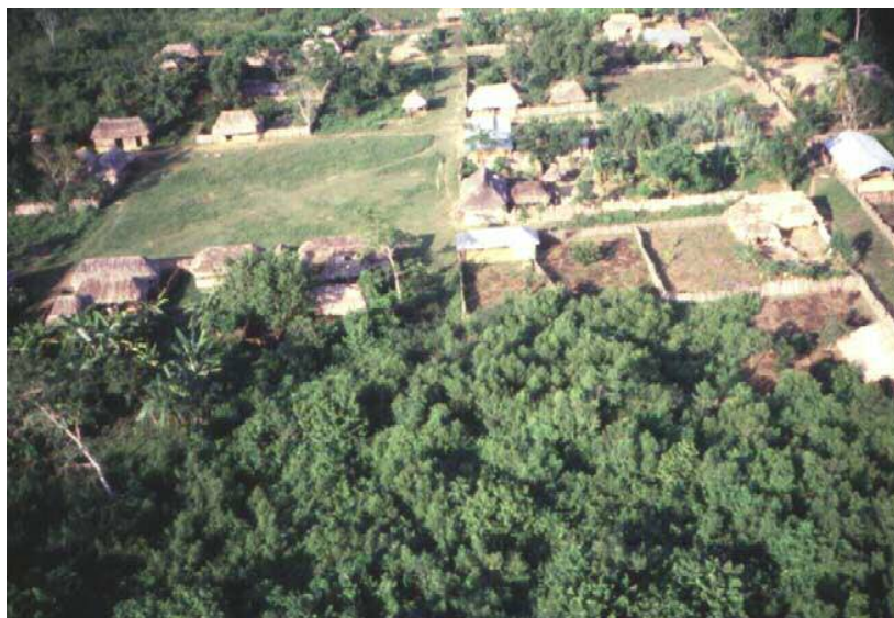
Foto aérea de la localidad de Chibogadó en el alto Sinú. Esta localidad desapareció bajo las