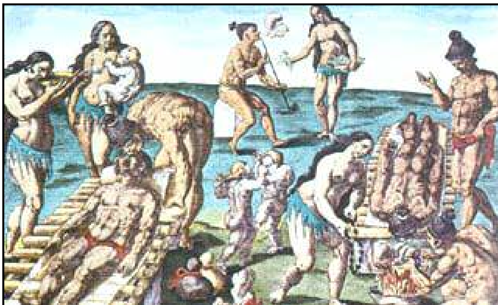
Figura No. 2. Gravado de Theodore de Bry (1590 - 1595). Efectos de las viruelas en los indígenas.

Identificación de los entes patógenos tanto en poblaciones prehispánicas como en los eventos de la posconquista nos abren una ventana al asunto de las complejas interrelaciones evolutivas de las poblaciones humanas y sus agentes parasitarios y patógenos. La separación de nuestros troncos evolutivos cuando los primeros asiáticos abandonaron su continente hace 15 mil años permite explicar las divergentes adaptaciones que en el caso del Viejo Continente habrían de capacitar a la humanidad para convivir con los animales domesticados y toda su carga viral y bacteriana, la cual, por supuesto, no estaría presente en nuestro continente hasta la llegada de los españoles y europeos, nuevos y virulentos huéspedes de estas microscópicas armas de destrucción masiva.