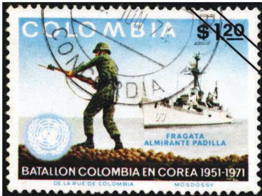
1972 20 años "Batallón Colombia en Corea 1951-1971", por un valor de $1.20.

Estampilla conmemorativa de los 20 años del Batallón Colombia en Corea 1951 -1971