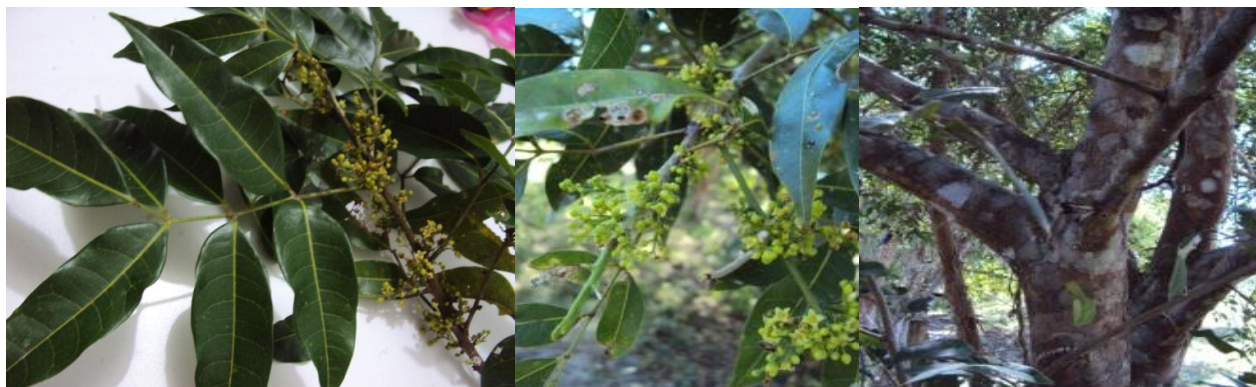
Figura 1 Imágenes de Protium heptaphyllum (Aubl.) March.