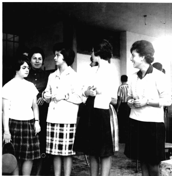
Presencia femenina en los inicios de la UTP