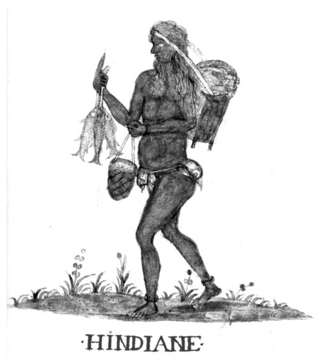
Figura 1. Dibujo del siglo XVI de mujer indígena del norte de Sudamérica. Tomado de The Pierpont Morgan Library (1996)