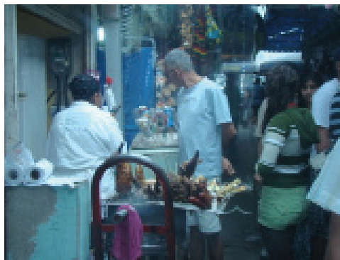
Rua localizada em área mais periférica. À esquerda, exemplo dos churrasquinhos mencionados anteriormente, muito comuns na Feira.