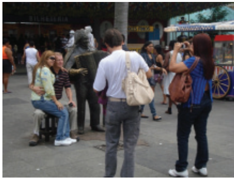
A estátua em bronze de Luiz Gonzaga em uma das entradas principais do Centro Luiz Gonzaga de Tradições Nordestinas. Na foto, turista americano posa para a foto com a esposa (brasileira).