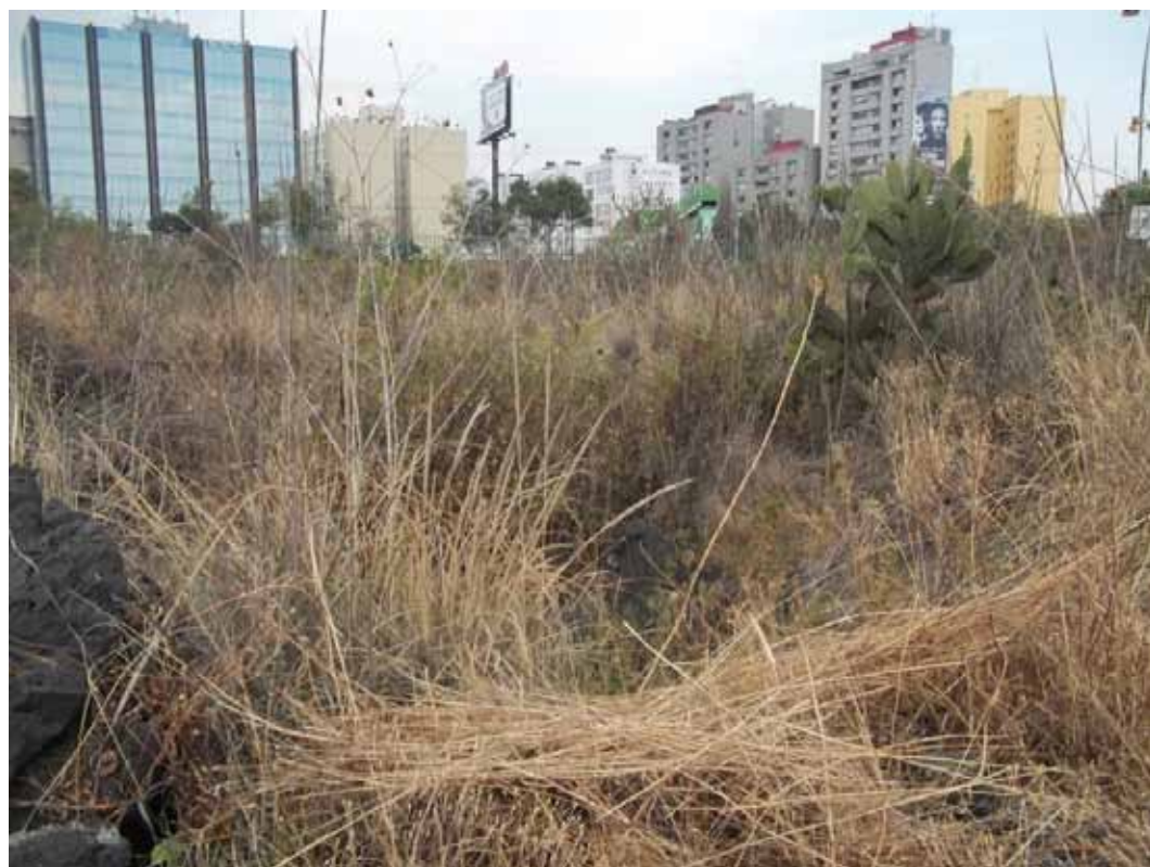
Foto 1. Matorrales secos en Cuicuilco

que pueden generar incendios. De acuerdo con el INAH, se registraron de uno a tres incendios por temporada en el periodo 2004-2009. Ninguno de ellos alcanzó la zona de monumentos, fueron desde pequeñas llamas hasta incendios con varios metros de extensión. En PET se destinaron más de 235 mil pesos para generar 25 empleos de abril a junio. Las tareas a realizar fueron el desyerbe, poda, mantenimiento de los andadores y limpieza general. De acuerdo al INAH, este programa de atención contra incendios forestales aplica desde ese año en la zona arqueológica, hecho contrastante con la realidad. Actualmente, la flora del sitio crece sin control ni cuidado alguno, se pueden encontrar algunos matorrales completamente secos impidiendo el crecimiento de los nuevos y con riesgo de encenderse (Foto 1). Por otra parte, en ese mismo año el Museo de Medicina Tradicional y Herbolaria, de Morelos, realizó un inventario florístico de la zona arqueológica. Se identificaron 64 tipos de plantas, de los cuales sobresalen estafiate, mastuerzo, oreja de burro y uña de gato (INAH, 2010).