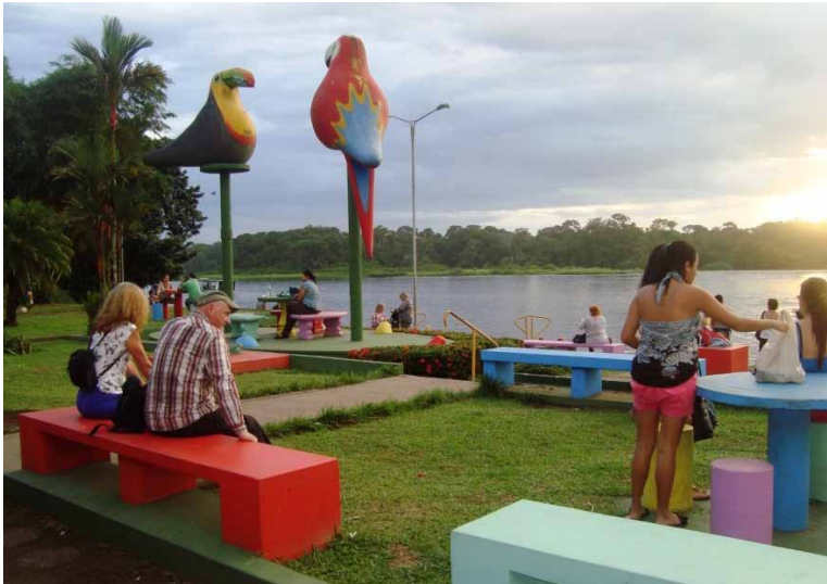
Fotografia 3: Turistas e comunitários ao pôr do sol e ao rio Tortuguero