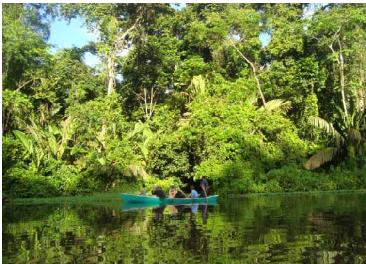
Autoria: Monica Araújo (2013)

Além dessas informações, os entrevistados vão afirmar que há, normalmente, três segmentos de turistas que se voltam para Tortuguero: aqueles que chegam em grupos, levados por operadoras de turismo ( all inclusive ) e que se hospedam em lodges ; os chamados mochileiros, que geralmente se albergam em cabinas ; e grupos de famílias costa-ricenses, além de outras tipificações que procuram a localidade. E mais, esse público-turista é diverso (Fotografia 3) e vai do jovem ao idoso.