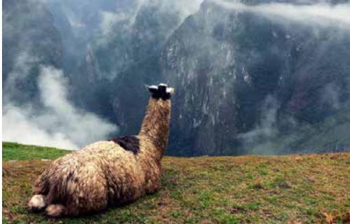
The Andes: Graveyard of Biodiversity