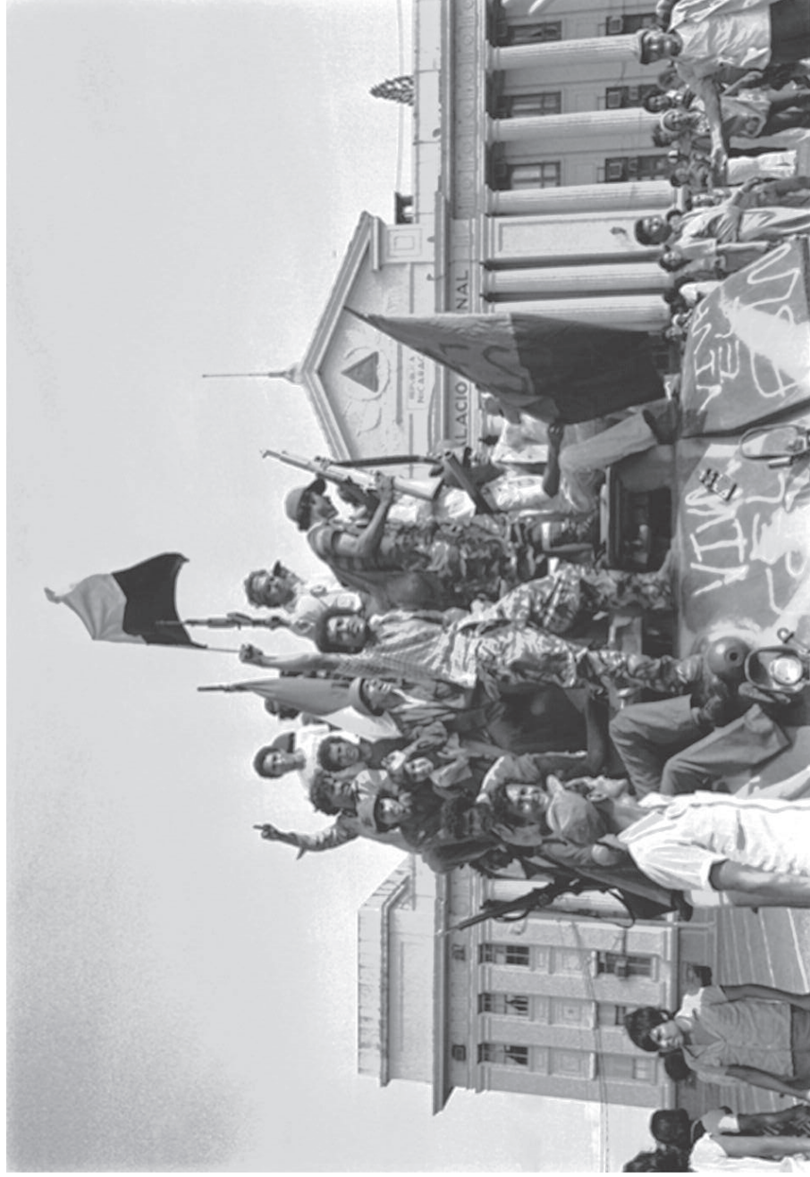
Fig. 6. Pedro Valtierra, Entrada triunfante de los sandinistas a la Plaza de la Revolución, Managua, Nicaragua, 19 de julio de 1979.