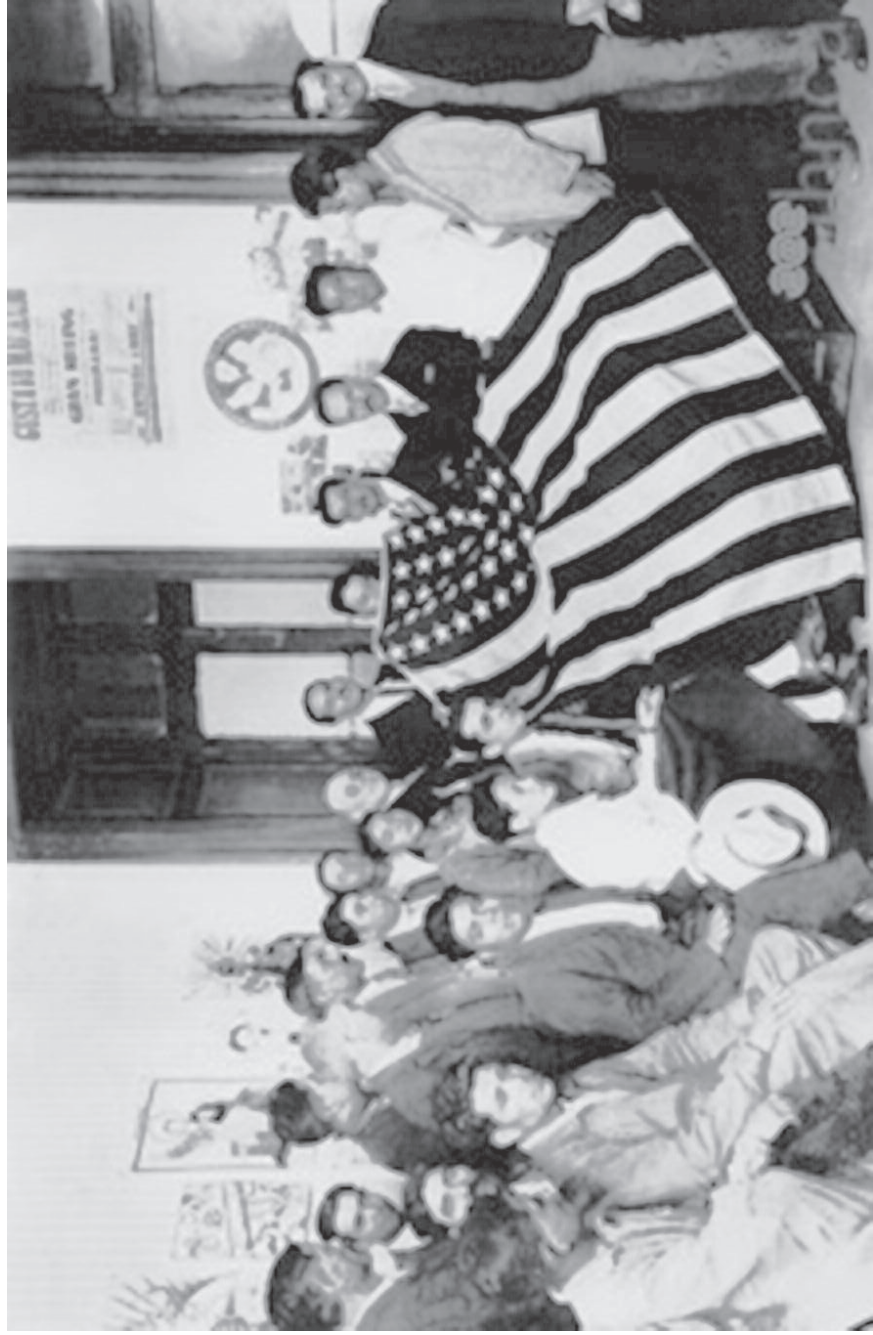
Fig. 7. Gustavo Machado entrega a la Liga Antiimperialista de las Américas, la bandera de los Estados Unidos capturada por el General Augusto C. Sandino a las tropas norteamericanas en Nicaragua. México, 1929. Instituto de Historia de Nicaragua y Centroamérica.