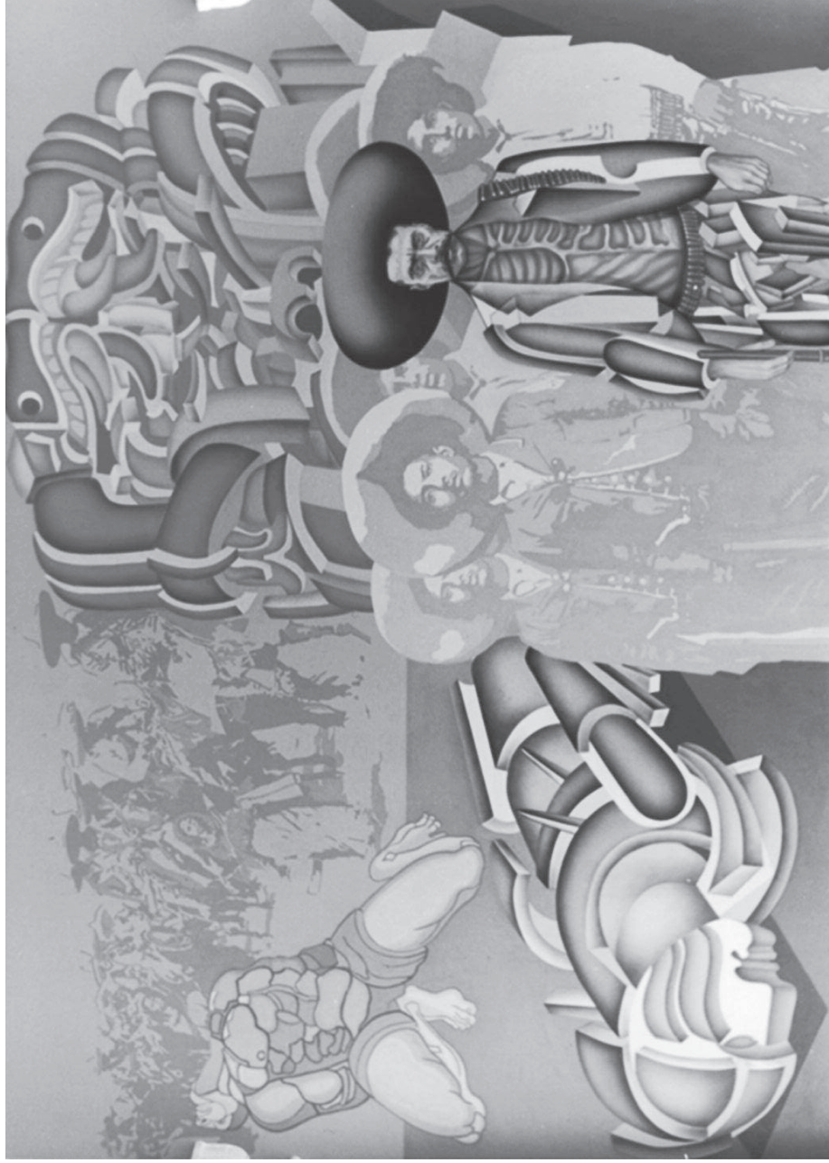
Fig. 8. Arnold Belkin, Los Prometeos. Zapata, 1987.