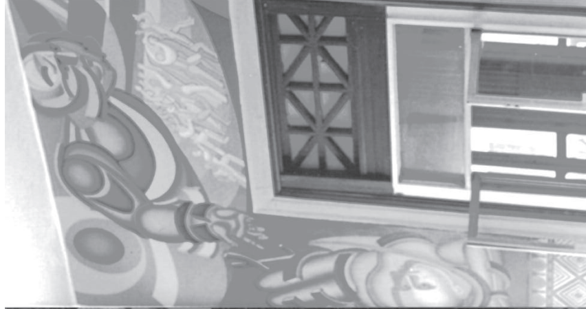
Fig. 2. Arnold Belkin, Los Prometeos, 1987. Detalle del muro central.