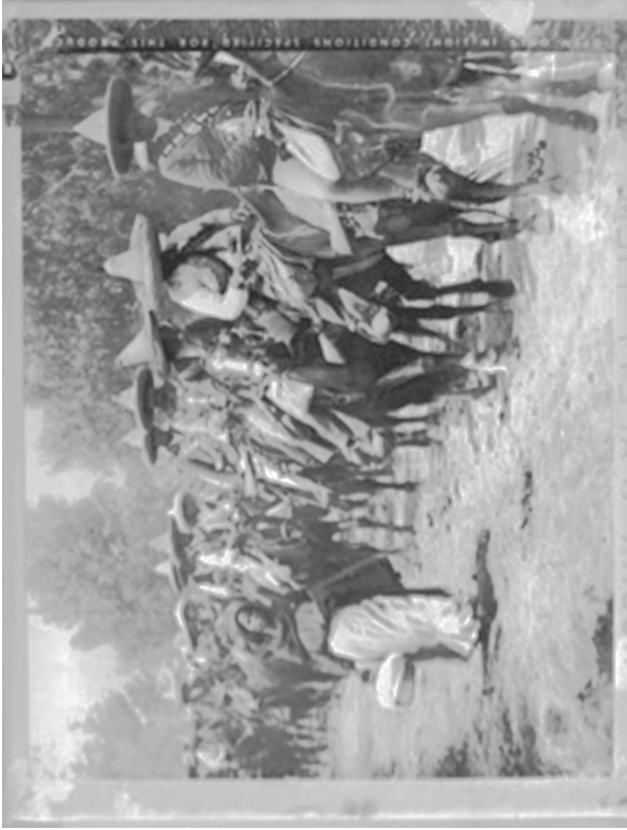
Fig. 9. Víctor Agustín Casasola, Zapatistas en camino a la Ciudad de México, 1914, SINAFO, Fototeca Nacional.