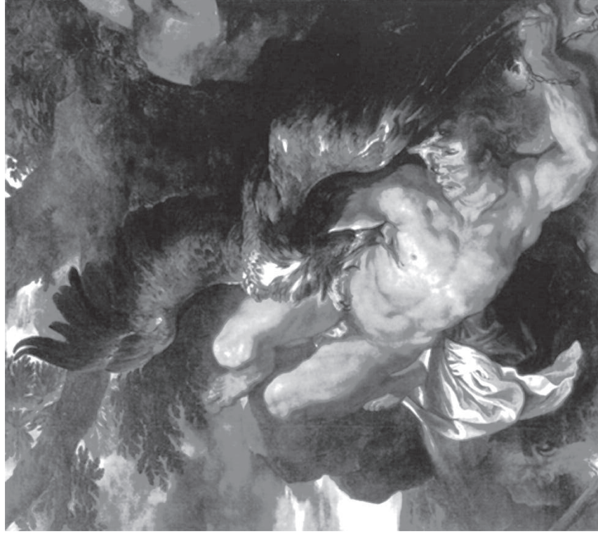
Fig. 1. Peter Paul Rubens, Prometeo aprisionado, 1612.