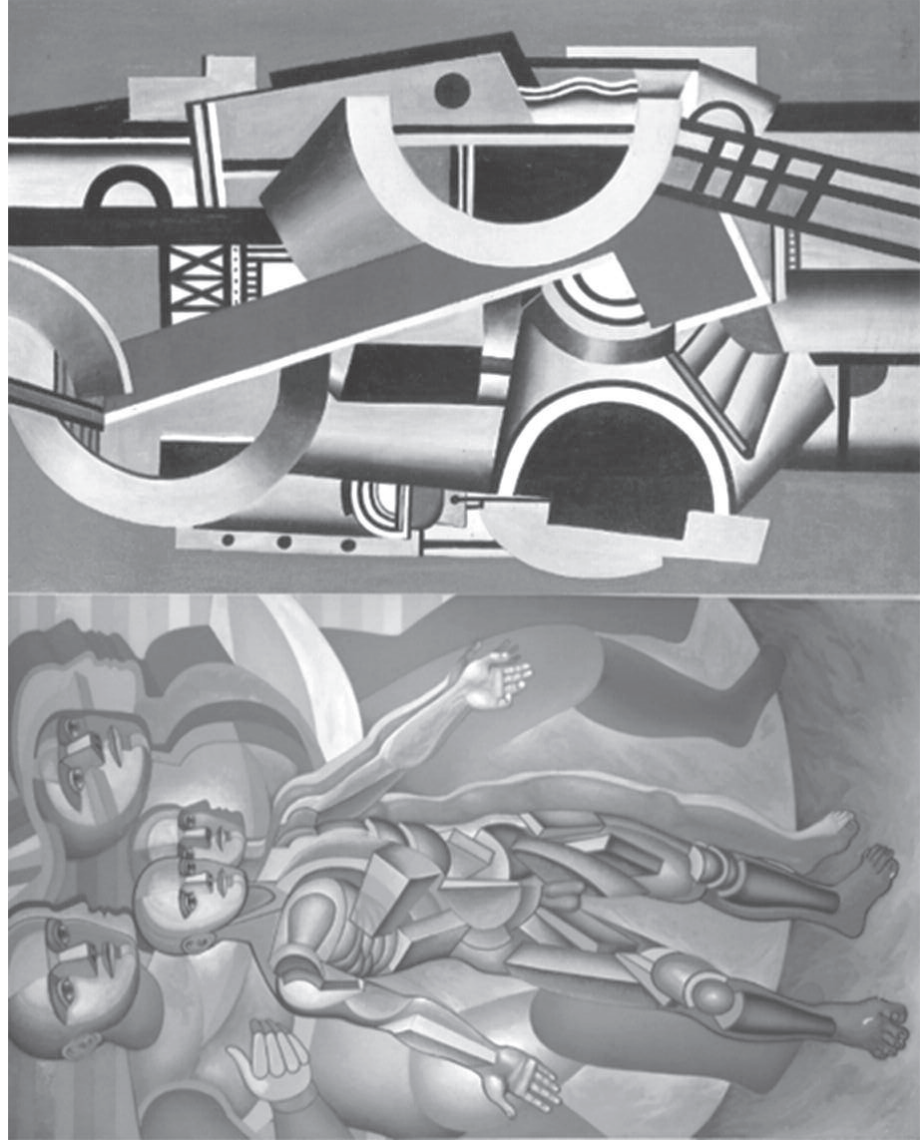
Fig. 3. Arnold Belkin, Los Prometeos , 1987. Detalle del muro central. Fig. 4. Fernand Léger, Elementos mecánicos , 1924.