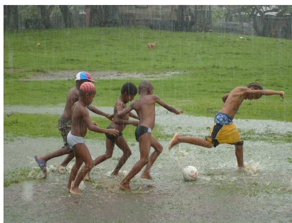
Imagen 4. Niños jugando en Orinoco