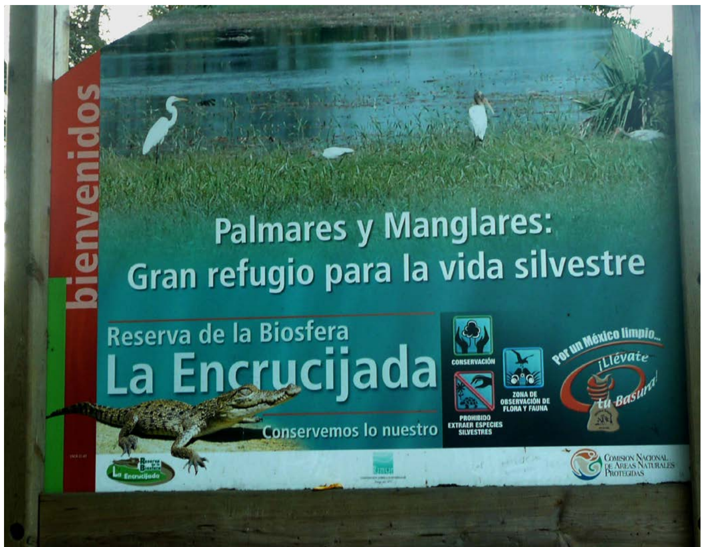
Figura 4. Cartel en la Reserva de la Biosfera La Encrucijada indicando algunos de los objetivos del área protegida.