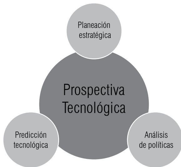
Ilustración 1. Origen de la prospectiva tecnológica 1

Según López & Correa (2007) el proceso prospectivo es un ejercicio multi-inter-transdisciplinario; iterativo, continuo, flexible; que debe desarrollarse coherentemente de acuerdo a un procedimiento sistémico con énfasis en el autocontrol para gestionar el conocimiento, aplicarlo, evaluarlo y ajustarlo; por