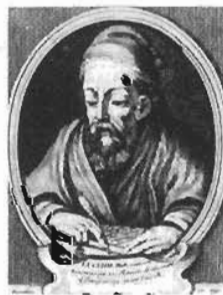
Figura 3. Pitágoras (582- 500 a.C) y Euclides (365 - 300 a.C.).