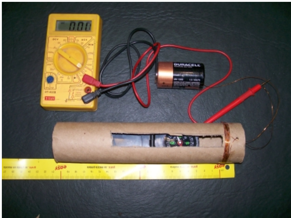
Figura 1.- Se observa el magnetómetro, las conexiones y el multímetro para medir la corriente.

En muchos casos el problema es que el campo generado es muy intenso y conviene alejar la brújula, de forma tal que se debe preparar el dispositivo para correr la brújula unos 5 cm o 10 cm. La construcción y disposición final, se muestran en la figura 1. La pila y el multímetro conviene colocarlos alejados para minimizar los efectos de campos parásitos.