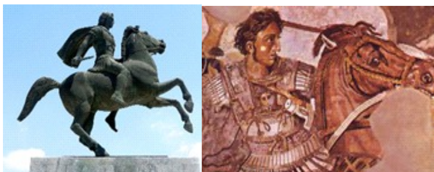
Alejandro Magno a caballo

Alejandro Magno (356 a J.C), se encontró con este conflicto que parecía insalvable. Debido a esta situación y sus tropas militares, logró invadir la ciudad, donde fue bien recibido por el pueblo. Y, poco a poco, se fue adueñando de todos los pueblos alrededor del Nilo.