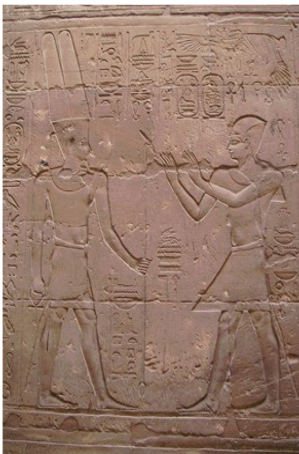
Alejandro Magno ante Amón-Ra

Al poco tiempo de estar ahí, en el año 332 a J.C, Alejandro fue coronado “Faraón”. Lo hizo tallar en los distintos templos sagrados de Egipto mostrando como Amón-Ra, le daba el poder de ser un Dios en la Tierra.