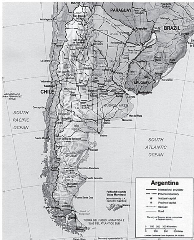
Figura 1. Argentina

La situación geográfica de la Argentina es un dato significativo que ayuda a entender la dinámica que han adquirido las organizaciones criminales en los últimos años, especialmente aquellas relacionadas al tráfico de drogas. Como se puede ver en la figura 1, Argentina limita al norte con Bolivia y Paraguay, al tiempo que comparte la frontera al noreste con Brasil. Argentina limita al norte con Bolivia y Paraguay, al tiempo que comparte la frontera al noreste con Brasil.