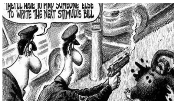
Caricatura del New York Post: ambigüedad del texto

Más clara, desde la óptica del discurso discriminatorio, es la imagen del New York Post en la que dos policías acorralan a un mono, por la ambigüedad del texto: “Tendrán que encontrar a otro para que escriba la próxima ley del estímulo” 9 . Aunque la caricatura podría ser interpretada a partir de un acontecimiento reciente -un chimpancé fue tiroteado en Connecticut- otras lecturas asociaban al animal con el máximo mandatario estadounidense que la vispera había anunciado la ley del estímulo económico.