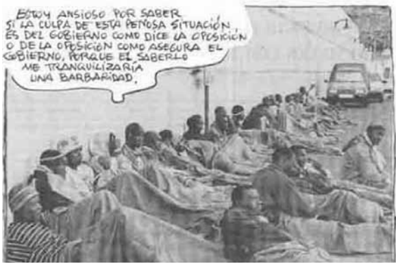
Mingote, ABC, 04/06/06. Modelo referencial hacia el sistema político

El dibujante Mingote, en el diario ABC, reproduce la imagen fotográfica de los inmigrantes. Estamos ante un modelo referencial, que a través de un bocadillo critica la actuación de