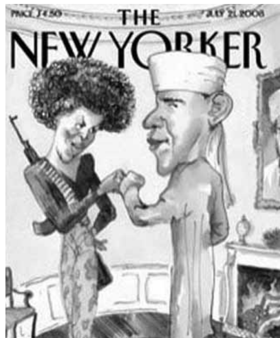
Obama y el islamismo según el New Yorker

su autor pretendía criticar los argumentos conservadores y no al entonces candidato a la Presidencia de los EEUU 8 .