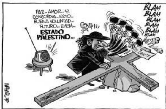
Manel Fontdevila, 2009, diario Público

Para analizar la representación de las religiones se selec-