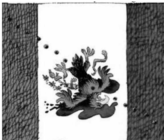
Caricatura sobre la violencia en México

Las identidades nacionales también participan de esta perspectiva crítica. Es el caso de la polémica caricatura firmada por Daryl Cagle publicada en la página web de la cadena estadounidense MSNBC sobre la violencia en México, con una deformación intencionada de la bandera y con el águila tiroteada 6 .