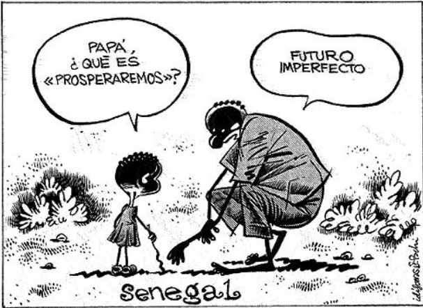
El Mundo, 04/06/06. Modelo conceptual hacia el ambiente social

En torno al mismo hecho, Idígoras y Pachi, en el diario El Mundo, trascienden el acontecimiento específico para situar en un campo de Senegal a un padre que, en la respuesta a su hijo, resume la ausencia de futuro. Aquí la mediación política cede terreno en beneficio de un modelo más conceptual que se centra en la tragedia de la inmigración.